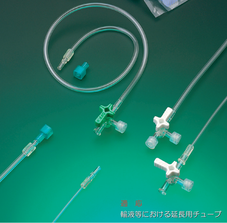
適用 輸液等における延長用チューブ