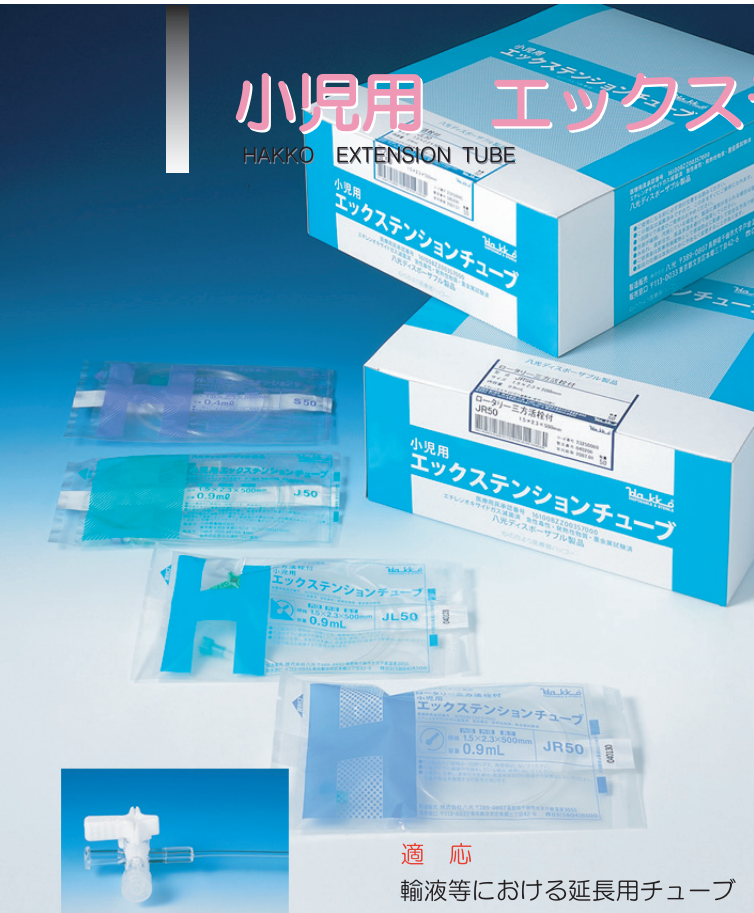
適用 輸液等における延長用チューブ