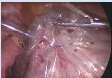
LH: laparoscopic hysterectomy (腹腔鏡下子宮摘出術)