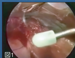
縫合針の受け渡しイメージ